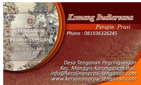
Gambar 3. Kartu Nama

Permasalahan mendesak yang dihadapi mitra tentunya memerlukan sebuah solusi sebagai bentuk kegiatan pengabdian masyarakat yang dilakukan. Solusi yang ditawarkan adalah pembuatan desain-desain untuk mempromosikan perajin dan berbagai karya yang dihasilkan oleh para perajin di desa. Karya-karya desain tersebut berupa kartu nama, katalog, CD Rom Interactive, brosur, dan website. Bentuk-bentuk dari karya tersebut adalah sebagai berikut :