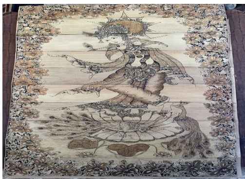
Gambar 2. Karya Komang Budiarsana dengan tema Dewa Krisna

perajin lontar ini memiliki kemampuan dalam membuat ilustrasi yang berbeda-beda. Dalam memilih gambar/ilustrasi, biasanya mereka menentukan dulu bagaimana cerita dari gambar / ilustrasi yang akan dibuat. Hal ini berkaitan dengan cara mereka menjual ke wisatawan baik wisatawan mancanegara maupun wisatawan domestik. Wisatawan biasanya akan bertanya apa arti dari gambar yang ada di lontar tersebut. Jika gambar tersebut dapat dijelaskan dengan baik dan menarik oleh perajin maka wisatawan pasti akan membeli lontar Prasi tersebut. Gambar/ilustrasi pulau Bali biasanya mereka jual dengan harga Rp. 80 ribu sampai Rp.150 ribu tergantung dari goresan pengrupak para perajin, sedangkan gambar /ilustrasi Dewi Saraswati, Dewa Krisna dan lain-lain yang memiliki nilai estetika dan tingkat kerumitan yang tinggi biasanya mereka jual berkisaran harga Rp. 1,3 juta sampai Rp.2 Juta per gambar yang terdiri dari 12 lembar daun lontar yang digabungkan menjadi satu bentuk lembaran. Berikut ini salah satu karya perajin prasi yang ada di Desa Tenganan Pegringsingan dengan tema gambar/ilustrasi Dewa Krisna. Gambar ini dikerjakan selama satu bulan lebih oleh Komang Budiarsana.