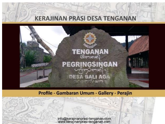
Gambar 6. Tampilan halaman depan CDRom interactive perajin Prasi