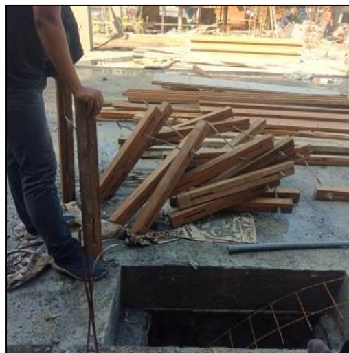
Gambar 6. Penggunaan material/bahan berulang untuk mengurangi adanya sampah konstruksi