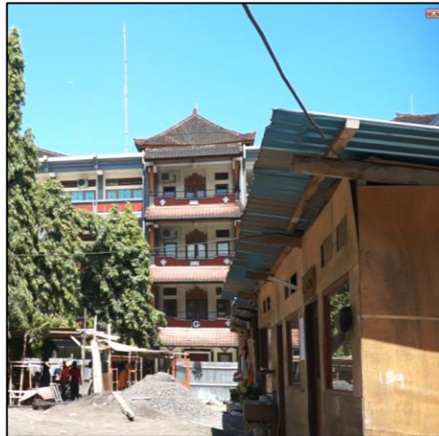
Gambar 7. Pemakaian fasilitas sementara ( temporary facility ) pada proyek.