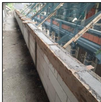
Gambar 3. Pemasangan safety net untuk melindungi agar tidak ada material yang terjatuh

Berdasarkan tabel diatas diperoleh capaian penerapan faktor tertinggi dengan persentase 80% pada faktor F11 penyimpanan dan perlindungan material, capaian penerapan aspek tertinggi dengan persentase 63% pada aspek A4 sumber daya dan siklus material. Diperoleh capaian penerapan faktor terendah dengan persentase 16% pada faktor F15 konservasi dan efisiensi air, capaian penerapan aspek terendah dengan persentase 27% pada aspek A6 konservasi air dan energi. Adapun beberapa dokumentasi penerapan konstruksi hijau pada proyek sebagai berikut: