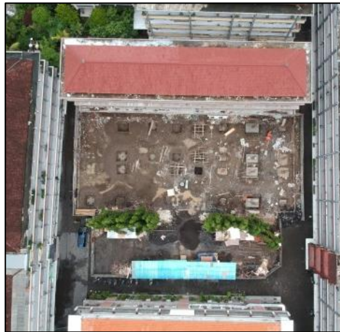
Gambar 8. Menetapkan batas proyek dengan memasang pagar di sekeliling lokasi proyek.