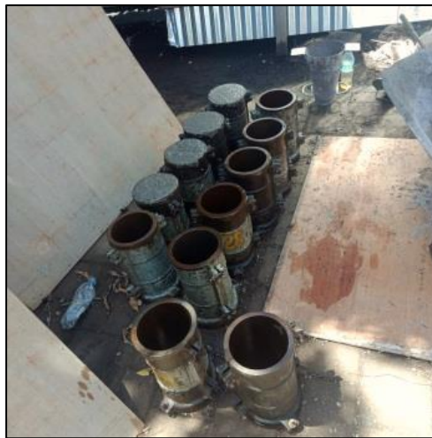
Gambar 5. Menyediakan cetakan untuk sisa agregat beton.