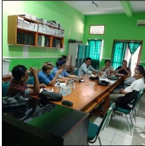
Gambar 4. Melakukan pertemuan rutin bersama seluruh stakeholder untuk membahas komitmen pemenuhan kualitas udara.