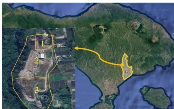
Gambar 1. Lokasi TPA Temesi Kabupaten Gianyar

Penelitian dilaksanakan di TPA Temesi, kabupaten Gianyar, yang berfungsi sebagai fasilitas utama pemrosesan akhir dengan sistem komposting dan landfill aktif. Pengambilan data dilakukan selama periode Januari – Mei 2025. Gambar 1 menunjukkan tata letak TPA Temesi yang terbagi menjadi zona komposting (1), area loading dan pemilahan (2), serta sel landfill aktif (3).