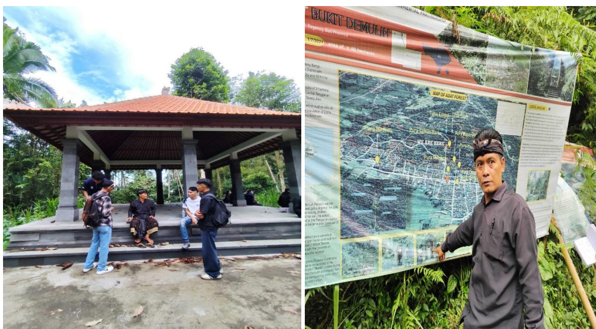
Gambar 5. Wawancara dengan Pemangku Hutan Adat Demulih

Dalam aspek pawongan, ini merujuk pada keterhubungan yang harmonis dengan orang lain, yang merupakan bagian dari kecerdasan sosial serta emosional. Penerapan komponen ini dapat memperbaiki kecerdasan emosional serta spiritual individu. Implementasi pawongan tercermin dalam Penetapan Hutan Adat dikelola oleh Masyarakat Hukum Adat (Desa Adat) Demulih sebagai Pemangku Hutan Adat dan pemanfaatan Hutan adat dengan Fungsi Produksi serta Pemerintah menghormati hak dan kewajiban Masyarakat Hukum Adat (Desa Adat) dalam mengelola dan memanfaatkan hutan adat. Peraturan (awig-awig) seperti larangan memasuki area tertentu saat berkabung, serta melarang penebangan tanpa izin, hal ini memperkuat rasa solidaritas dan kesadaran warga untuk bersama-sama menjaga dan merawat hutan adat. Gambar 5 memperlihatkan salah satu Pemangku Hutan Adat Demulih sekaligus narasumber yang memberikan informasi terkait hak dan kewajiban sebagai pengelola hutan adat.