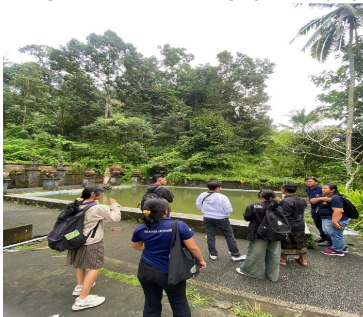
Gambar 4. Salah Satu Kolam Air di Hutan Adat Demulih

Dalam pengelolaan hutan adat terdapat aturan ( awig-awig ) yang melarang memasuki area hutan selama 12 hari saat ada warga meninggal. Hal ini sebagai bagian dari upaya menjaga kesucian kawasan (Surata et al. , 2022). Aturan ini diberlakukan sangat ketat, tidak ada pengecualian dan untuk kepentingan apa pun dan siapa pun. Aturan ini pada hakikatnya merupakan wujud harmonisasi masyarakat desa dengan Tuhan (parahyangan) yang bertujuan menjaga kesucian Pura di desa tersebut (Sari et al. , 2024). Selain itu, keanekaragaman hayati di hutan ini sangat kaya, dengan sumber mata air alami yang sebagian telah dimanfaatkan oleh masyarakat setempat untuk keperluan mandi serta sebagai tempat untuk melukat (proses penyucian diri). Hasil wawancara dengan narasumber bahwa pada beberapa titik tertentu kolam air di Hutan adat Demulih menurut para pengelola hutan akan dijadikan tempat wisata religi yang menyediakan tempat untuk melukat dan tempat persembahyangan.