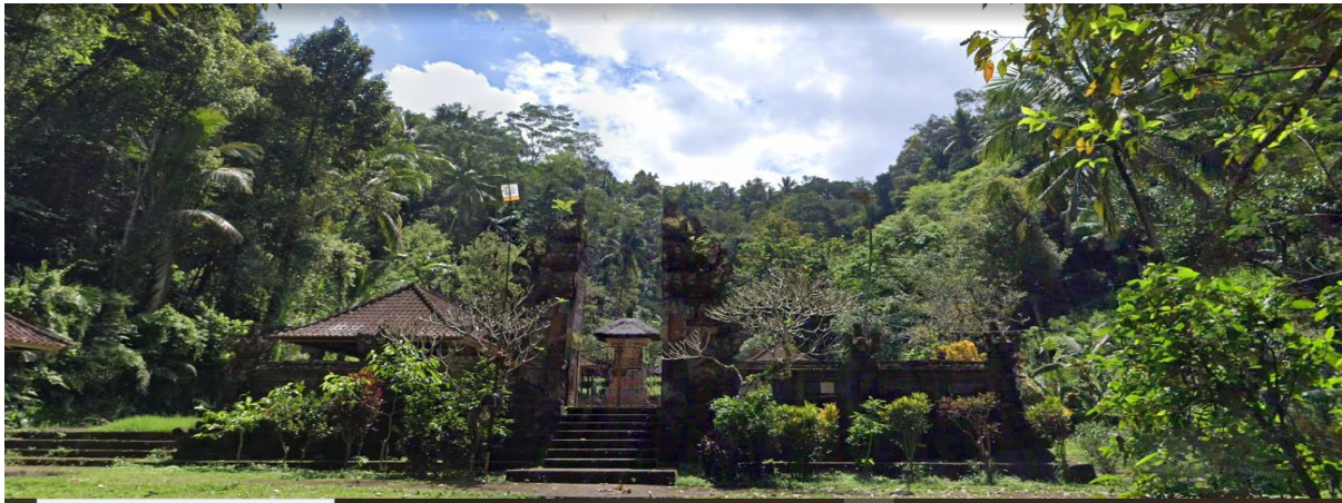
Gambar 3. Pura Taman Hutan Adat Bukit Demulih

Dalam pengelolaan hutan adat terdapat aturan ( awig-awig ) yang melarang memasuki area hutan selama 12 hari saat ada warga meninggal. Hal ini sebagai bagian dari upaya menjaga kesucian kawasan (Surata et al. , 2022). Aturan ini diberlakukan sangat ketat, tidak ada pengecualian dan untuk kepentingan apa pun dan siapa pun. Aturan ini pada hakikatnya merupakan wujud harmonisasi masyarakat desa dengan Tuhan (parahyangan) yang bertujuan menjaga kesucian Pura di desa tersebut (Sari et al. , 2024). Selain itu, keanekaragaman hayati di hutan ini sangat kaya, dengan sumber mata air alami yang sebagian telah dimanfaatkan oleh masyarakat setempat untuk keperluan mandi serta sebagai tempat untuk melukat (proses penyucian diri). Hasil wawancara dengan narasumber bahwa pada beberapa titik tertentu kolam air di Hutan adat Demulih menurut para pengelola hutan akan dijadikan tempat wisata religi yang menyediakan tempat untuk melukat dan tempat persembahyangan.