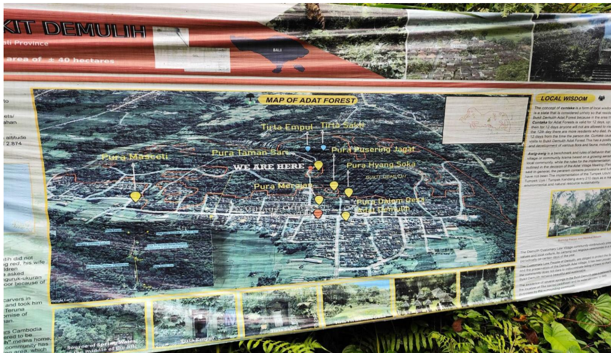
Gambar 2. Poster Hutan Adat Demulih (Sumber: dokumentasi penulis. 2024)

Dalam interaksi antara individu dan Tuhan (parhyangan), keselarasan manusia di hadapan Tuhan Yang Maha Esa merujuk pada semua usaha yang dilakukan oleh individu dengan cara yang positif untuk mencapai keselarasan antara manusia dan Tuhan Yang Maha Esa dengan menekankan prinsip-prinsip kemanusiaan, serta dengan menghormati dan menghargai sesama manusia sebagai makhluk ciptaan Tuhan (Hutasoit dan Wau, 2017). Aspek parhyangan tercermin dari kegiatan upacara ( piodalan ) yang diselenggarakan oleh masyarakat dan pengelola hutan adat Demulih di sebelas Pura yang terdapat di dalam Kawasan hutan adat yang membuktikan bahwa masyarakat sangat menjaga ikatan spiritual dengan Tuhan. Selain menjalankan kegiatan piodalan, juga terdapat kolam dan pancuran untuk pelaksanaan melukat yang terbuka bagi seluruh masyarakat dengan didampingi oleh pengelola hutan adat. Sehingga keberadaan Pura-Pura dan tempat melukat untuk pembersihan diri tersebut menunjukkan bahwa area hutan bukan hanya ruang fisik, melainkan juga wilayah suci yang menghubungkan manusia dengan Sang Pencipta. Gambar 2 menunjukkan poster hutan adat Bukit Demulih dan titik-titik lokasi Pura yang terdapat di dalam Hutan Adat sedangkan Gambar 3 menunjukkan Pura Taman hutan adat Bukit Demulih