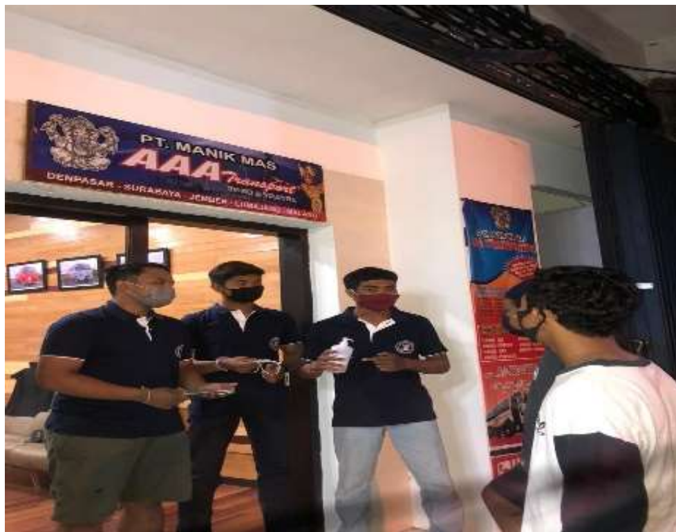
Gambar 2. Memberikan Penyuluhan kepada Karyawan

Kegiatan kedua, yaitu edukasi mengenai tips aman dari Covid-19 di tempat umum selama pandemi Covid-19. Sejak pandemi Covid-19 muncul, hampir semua orang mengalami kendala untuk menjalani kehidupan normal akibat pembatasan yang perlu dilakukan untuk mencegah penularan virus Corona. Pandemi Virus Corona Covid-19 membuat banyak orang memilih berdiam diri di rumah. Namun, tidak menutup kemungkinan, ada yang masih meninggalkan rumah untuk belanja kebutuhan pokok dan obat-obatan, bekerja, maupun sekedar menghirup udara segar. Oleh karena itu tujuan dari program kerja ini adalah meningkatkan pengetahuan dan pemahaman karyawan mengenai perilaku dalam tips aman dari Covid-19 di tempat umum di masa pandemi Covid-19. Kegiatan ini dilaksanakan pada tanggal 21 Agustus dan 24 Agustus 2020 dalam bentuk penyuluhan yang dibagi menjadi 2 sesi guna pengaplikasian protokol kesehatan Covid-19 yaitu sosial distancing .