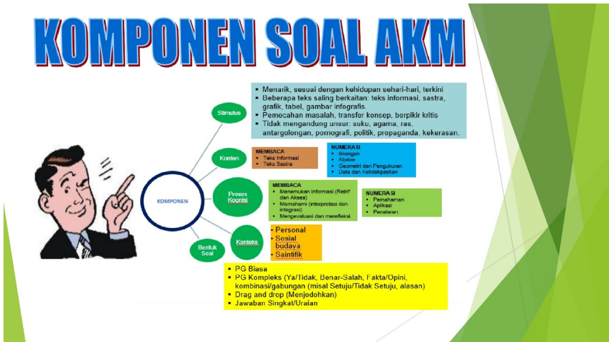
Gambar 1. Materi Workshop Penyusunan Soal Berbasis AKM

Guru dituntun untuk memperhatikan konteks teks soal yang akan disusun. Adapun konteks soal yang dapat dijadikan pedoman dalam menyusun soal AKM adalah konteks personal, sosial budaya, dan saintifik. Selain itu, guru dapat memperhatikan bentuk soal dalam menyusun soal AKM. Adapun bentuk soal dapat berupa pilihan ganda biasa, pilihan ganda kompleks (ya/tidak, benar/salah, fakta/opini, kombinasi/gabungan, setuju/tidak setuju, alasan), drag and drop (menjodohkan), jawaban singkat/uraian. Dari beberapa komponen tersebut diharapkan guru mampu memahami dan mengaplikasikan hal tersebut dalam penyusunan asesmen AKM literasi.