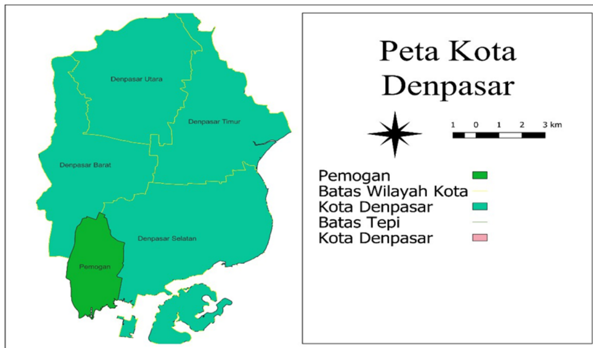
Gambar 2. Peta Kota Denpasar

Penelitian menggunakan jenis data primer bersifat kualitatif, merupakan data yang didapatkan dari bentuk kalimat pernyataan, uraian, dan deskripsi yang mengandung suatu makna serta nilai tertentu. Data ini diperoleh melalui wawancara mendalam dengan subyek penelitian yang telah dipilih sebagai partisipan (Herdiansyah, 2013). Data sekunder yaitu data yang diambil dari buku profil, laporan, hasil-hasil penelitian dan dokumen lainnya seperti data geografi, demografi dan capaian program periode sebelumnya. Penelitian ini menggunakan instrumen yang berbentuk kuisioner dan wawancara mendalam. Sumber data utama dalam penelitian kualitatif adalah kata-kata dan tindakan, selebihnya adalah data tambahan seperti dokumen dan lain-lain. Oleh karena itu, peran peneliti sebagai instrumen penelitian sangat penting artinya dalam konteks pengamatan (Moleong, 2013).