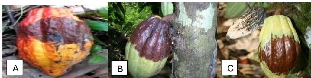
Gambar 1. A) Gejala penyakit pada bagian Tengah buah, B) Gejala Penyakit Pada Bagian Pangkal Buah Kakao, C) Gejala Penyakit padaujung buah

Phytophthora adalah penyebab penyakit penting pada kakao, pathogen ini menyebabkan penyakit busuk buah, kanker batang, hawar daun, hawar bibit, dan layu tunas air. Berdasarkan pengamatan dilapangan menunjukkan bahwa busuk buah merupakan penyakit paling dominan dan menyebabkan kerugian yang besar. Gejala serangan yang ditimbulkan oleh jamur ini berupa adanya bercak hitam kecoklatan yang dimulai dari pangkal buah kemudian menyebar hampir menutupi seluruh permukaan buah dan timbul lapisan dengan warna putih bertepung. Perkembangan bercak cukup cepat, sehingga dalam waktu beberapa hari seluruh permukaan dan isi buah menjadi busuk. Bercak-bercak hitam ini akan meluas hingga menutupi semua bagian kulit buah jika tidak dilakukan pengendalian. Gejala timbul pada buah dengan berbagai tingkatan umur mulai dari buah masih kecil sampai buah menjelang masak. Buah kakao yang terinfeksi dapat dilihat pada Gambar 1 berikut.