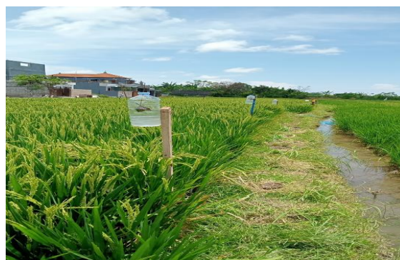
Gambar 4. perangkap bangkai keping di lapangan