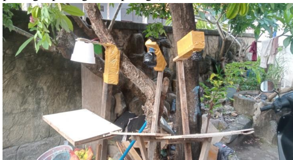
Gambar 1. perangkat lampu

Bahan-bahan yang digunakan dalam penelitian adalah alat perangkat tenaga surya (Gambar 1) dan alat perangkat bangkai kepiting (Gambar 2).