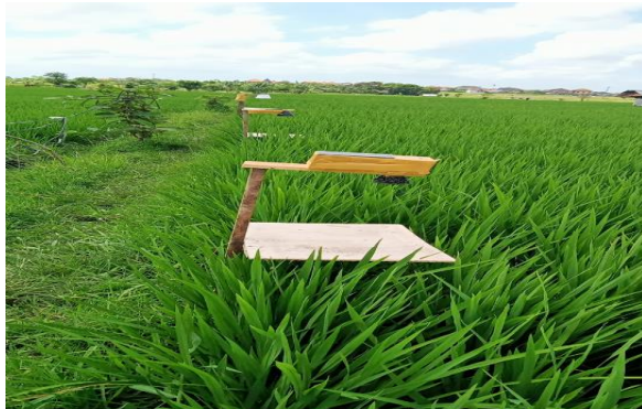
Gambar 3. perangkap lampu di lapangan

Penelitian telah dilaksanakan di Desa Penatih Denpasar Utara pada lahan sawah tanaman padi selama 5 minggu mulai pada fase tanaman padi pengisian bulir yaitu mulai umur 8 minggu sampai 13 minggu setelah tanam (Gambar 3 dan Gambar 4). Jenis perangkap Walang sangit yaitu Perangkap lampu dan Perangkap bangkai keping dipasang di lahan sawah selama penelitian dan hasil tangkapan alat perangkap diamati dan dihitung setiap 3 hari selama 18 kali pengamatan.