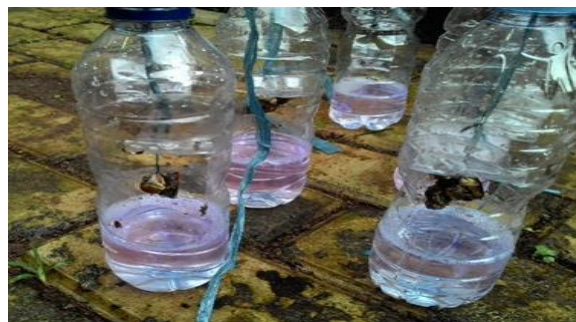
Gambar 2. perangkat bangkai kepiting

Alat perangkat lampu dengan memerlukan bahan-bahan sbb: panel surya, kabel, timah, modul charger 5v, baterai, IRFZ44N, resistor 100k, sensor LDR, kayu 2 m, papan, dan paku, Alat perangkat bangkai kepiting dipersiapkan dengan bahan-bahan yaitu: kepiting, botol plastik, air dan tali. Alat yang digunakan dalam penelitian ini adalah: Solder, obeng, parang, gergaji, palu, meteran, pisau tajam, dan kait dari kawat.