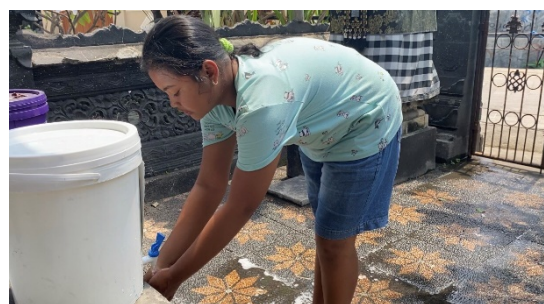
Gb.6 Anak-anak melakukan post-test

Setelah seluruh kegiatan sosialisasi dilakukan maka hari berikutnya pelaksana program melakukan post-test dan peninjauan kembali (gambar 6). Terlihat anak-anak yang sebelumnya masih salah dengan cara mereka mencuci tangan kini sudah dapat mencuci tangan mereka dengan benar. Setelah itu program yang dilakukan mahasiswa ialah membagikan masker dan vitamin kepada warga sekitar (gambar 7).