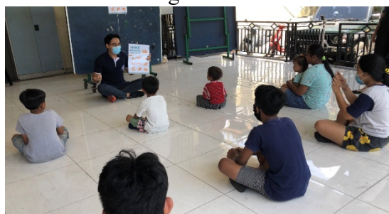
Gb.4. Suasana saat sosialisasi berlangsung

Selain sosialisasi, pengadaan demonstrasi atau praktikum membuat mereka semakin mudah memahami ditambah dengan antusias peserta sosialisasi sangat membantu keberhasilan sosialisasi ini (gambar 5).