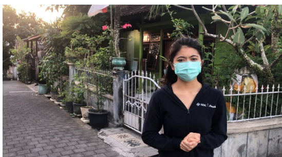
Gb.8 Tanggapan oleh ketua Teruni Perumahan Lembu Sura

Ungkapan terima kasih atas keberhasilan program juga disampaikan oleh ketua Teruni Perumahan Lembu Sura (gambar 8). Ia mengatakan bahwa program yang telah dilakukan ini manfaatnya sangat baik bagi warga sekitar khususnya anak-anak, terkait situasi saat ini, pengetahuan tentang pola hidup bersih dan sehat seperti cara mencuci tangan dengan benar sangat diperlukan saat ini, tak lupa juga vitamin sangat membantu dalam menjaga system kekebalan tubuh, diharapkan program yang telah dilaksanakan dapat berguna bagi warga sekitar dan edukasi yang telah diberikan dapat diterapkan dalam kehidupan sehari-hari.