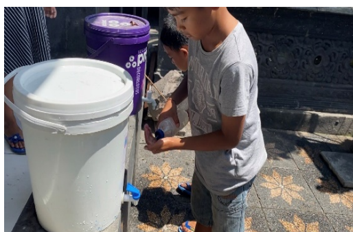
Gb.2. Pre-test untuk anak-anak sebelum sosialisasi

Sebelum dilakukannya sosialisasi akan dilakukan pre-test guna mengetahui pengetahuan anak-anak itu sendiri (gambar 2), sosialisasi dilakukan dengan menggunakan Bahasa yang mudah dipahami, lagu-lagu, pemberian demo dan praktek langsung cara mencuci tangan