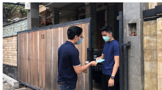
Gb.7 Pembagian masker dan vitamin kepada warga sekitar