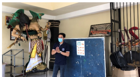
Gb.3 Pemberian demonstrasi tentang cara mencuci tangan