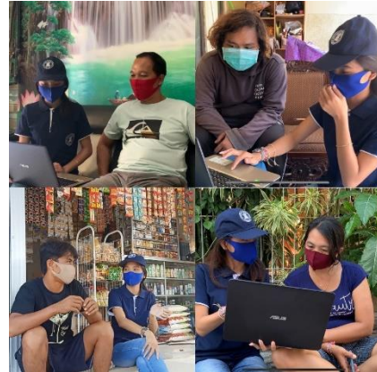
Gambar 2. Pendampingan secara langsung dan memberikan pemahaman mengenai berbisnis online kepada pemilik UMKM.

Dengan Kreativitas di Desa Padangsambian Kaja dilakukan pada tanggal 22 Agustus 2020 sampai dengan tanggal 12 September 2020 berjalan lancar dengan ketercapaian kegiatan sangat baik yaitu 100%.