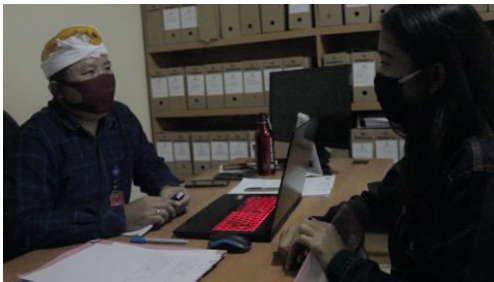
Gambar 1. Mahasiswa Mahasaraswati sedang melakukan observasi ke Kantor Desa Padangsambian Kaja.

Sebelum kegiatan pengabdian pada masyarakat dimulai, terlebih dahulu dilakukan observasi untuk menentukan masyarakat sasaran. Dari beberapa UMKM yang ada, ditemukan ada 4 UMKM yang berada disekitar rumah. Maka dari itu, Pengabdian Pada Masyarakat Universitas Mahasaraswati Denpasar melakukan kegiatan meningkatkan perekonomian UMKM dengan kreativitas ke 4 UMKM yang berada disekitar rumah, mengingat adanya situasi Covid-19. Kegiatan ini dilakukan dengan sosialisasi melalui daring dan pendampingan secara langsung.