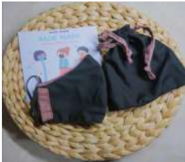
Gambar 1. Produk yang dihasilkan

melainkan dibantu juga dalam bahan untuk memproduksi produk tersebut. Masker kain yang dibuat menggunakan bahan kain katun premium dan juga diberikan beberapa inovasi yaitu penambahan pouch untuk menaruh masker kain sehingga masker tetap bersih dan tidak tercecer.