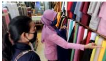
Gambar 5. Pembelian bahan baku untuk pembuatan masker

untuk membuat produk tersebut ,mempromosikan UMKM melalui media digital, serta melakukan kegiatan produksi produk, logo dan kemasan produk. Tetapi karena pemilik UMKM belum bisa menggunakan media digital sebagai media promosi, maka dari itu peneliti mulai membantu dalam memperkenalkan media digital Instagram dan shopee sebagai media promosi. Mengajarkan cara membuat serta menjalankan aplikasi tersebut. Setelah berjalan beberapa hari ternyata kegiatan ini mendatangkan respon yang baik. Banyak pengguna Instagram mulai memfollow akun Instagram wasikitailor. Dengan begini dapat memperlihatkan bahwa kegiatan ini berhasil dilakukan, karena dapat menjangkau konsumen luas untuk mengetahui Usaha Jero Wasiki ini