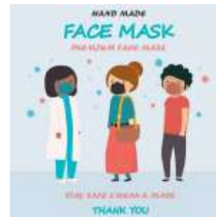
Gambar 4. tampilan kemasan masker

Kegiatan selanjutnya yang dijalankan adalah membantu dalam hal proses produksi produk masker kain agar nantinya produk yang akan dibuat sesuai dengan usulan sebelumnya. Selain itu pada saat wawancara dikatakan bahwa usaha Jero Wasiki belum memiliki logo usaha maka dari itu pada kesempatan ini peneliti juga memanfaatkan pemuda desa untuk membantu dalam mendesign logo produk dan juga mendesign kemasan agar nilai jual produk semakin tinggi.