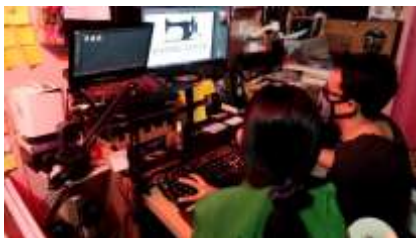
Gambar 8. Kegiatan mendesign logo dan kemasan