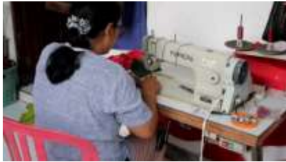
Gambar 7. Kegiatan produksi

produksi mulai dari kegiatan produksi produk masker kain serta membantu dalam hal mendesign logo serta kemasan sehingga mendapatkan nilai jual yang tinggi