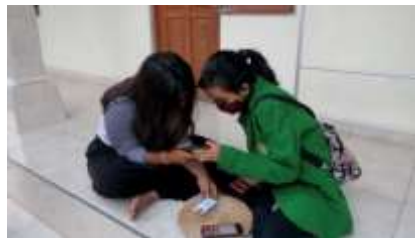
Gambar 6. Mengaplikasikan penggunaan dan pembuatan media digital sebagai sarana promosi

Selain memberikan solusi, memberikan bahan serta memperkenalkan media digital sebagai media promosi kegiatan kali ini juga membantu dalam hal kegiatan