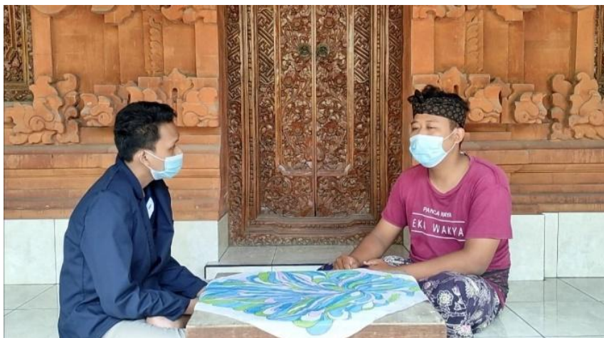
Gambar 1. Kegiatan observasi oleh mahasiswa kepada anggota Sekaa Truna.

Dalam kegiatan Pengabdian Masyarakat Peduli Bencana COVID-19 ini partisipasi masyarakat mulai dari perencanaan dan menyusun program kerja ini sangat banyak membantu, penulis dibantu oleh ketua dan anggota Sekaa Truna dalam keadaan yang terjadi di Banjar Kedaton Kesiman selama pademi COVID-19. Dilihat dari hal tersebut ini berarti, bahwa ketua dan anggota Sekaa Truna sangat mendukung dengan adanya kegiatan positif yang dapat membantu mereka untuk bisa menaati protokol kesehatan dan dapat memahami tentang bagaimana cara penggunaan zoom meeting sebagai kegiatan komunikasi dalam rapat secara daring di masa pandemi.