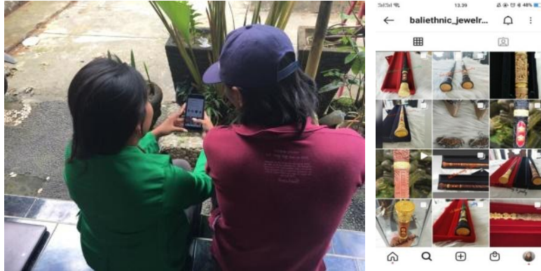
Gambar 2. Pembuatan dan pemeliharaan akun media sosial

memberikan pelatihan dan pembuatan akun media sosial pada pelaku UMKM Kerajinan Seni Ukir Tulang Bali Ethnic Carving & Jewelry Studio pada aplikasi Instagram dan Facebook. Dengan begitu pelaku UMKM dapat mempromosikan barang yang dijual dengan maksimal dengan jangkauan jaringan yang lebih luas.