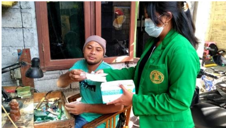
Gambar 1. Pemberian masker dan slop tangan

Kerajinan ukiran tulang ini menghasilkan debu yang masih belum tertangani dengan baik. Hal ini tentunya akan sangat mengganggu proses produksi terutama akan sangat berdampak pada kesehatan para pekerja. Debu-debu halus hasil sisa kerajinan itu sangat mudah terhirup dan akan sangat mengganggu pernafasan para pekerja. Bahaya yang paling besar adalah debu halus dari proses produksi kerajinan ini dapat terhirup oleh pekerja, sehingga dapat menyebabkan gangguan pernapasan sampai kemungkinan jangka panjang dapat menyebabkan kanker paru-paru. Ditambah lagi, para pekerja juga kurang menyadari mengenai pentingnya menggunakan masker dan selop tangan saat melakukan proses produksi. Oleh karena itu tim memberikan bantuan berupa masker dan handsanitizer yang bertujuan agar pelaku UMKM tetap memperhatikan kesehatannya ditempat usaha.