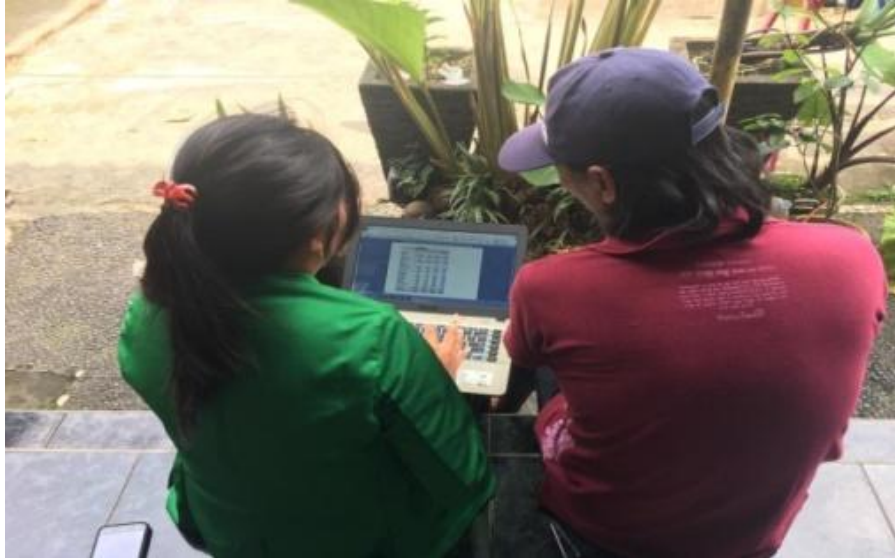
Gambar 4. Pelatihan pembukuan sederhana

Kerajinan Seni Ukir Tulang Bali Ethnic Carving & Jewelry Studio bertujuan agar UMKM memiliki laporan keuangan sebagai pertanggungjawaban usahanya. Dengan begitu pelaku UMKM bisa dengan mudah menghitung pendapatan dan pengeluarannya.