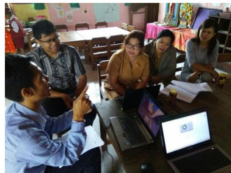
Gambar 5 Pelatihan pemanfaatan website

kegiatan pengabdian masyarakat tentang IbM pengembangan usaha Jajanan tradisional terlaksana sesuai dengan rencana, sesuai dengan sosialisasi. Peserta sangat antusias dan kami mendapat masukan bahwa kegiatan pelatihan khususnya penggunaan internet dalam pemasaran harus dilakukan berkesinambungan karena pelatihan ini