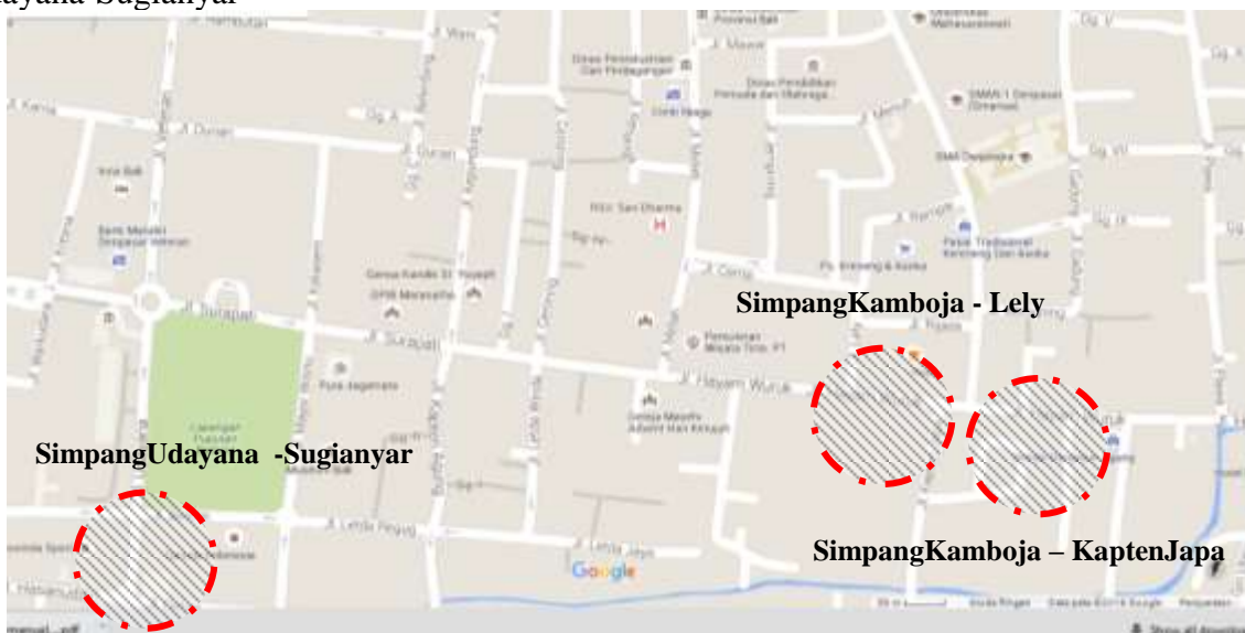
Gambar 2 : Lokasi Penelitian

Penelitian dilakukan pada simpang Kamboja-Kapten Japa, Kamboja-Lely dan Udayana-Sugianyar