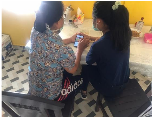
Gambar 3. Mendampingi Mempromosikan Produk melalui Media Sosial.

Hasil evaluasi setelah dilaksanakannya pelatihan pengoperasian media sosial, masyarakat sasaran lebih lancar mengoperasikan media sosial setelah melaksanakan beberapa kali pelatihan. Masyarakat sasaran menjadi lebih mengetahui bagaimana mengoperasikan media sosial sehingga dapat dimanfaatkan untuk mempromosikan produknya di media sosial.