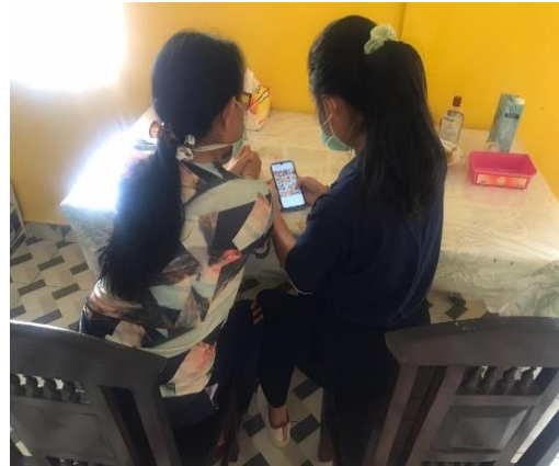
Gambar 3. Pelatihan Pengoperasian Media Sosial.

pada Instagram , Semprit Gigit pada Facebook . Kemudian dilanjutkan dengan latihan menerima pesanan pada setiap akun media sosial jikalau ada yang memesan.