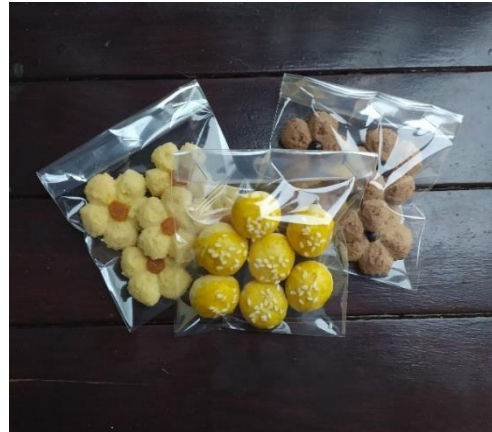
Gambar 1. Kemasan Produk UKM Kue Kering.

sebagai media promosi tidak dilakukan oleh UKM Kue Kering. Promosi hanya dilakukan dengan menitipkan dari warung ke warung. Selain itu dari segi pengemasan, produk dari UKM Kue Kering kurang menarik seperti pada gambar di bawah ini.